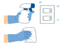
使用前の館内清掃 アルコール消毒の徹底