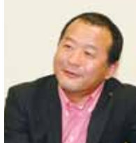
私の一筆 株式会社ロゴスコアポレーション 代表取締役社長