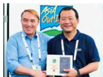
南京アウトドアショー アワード